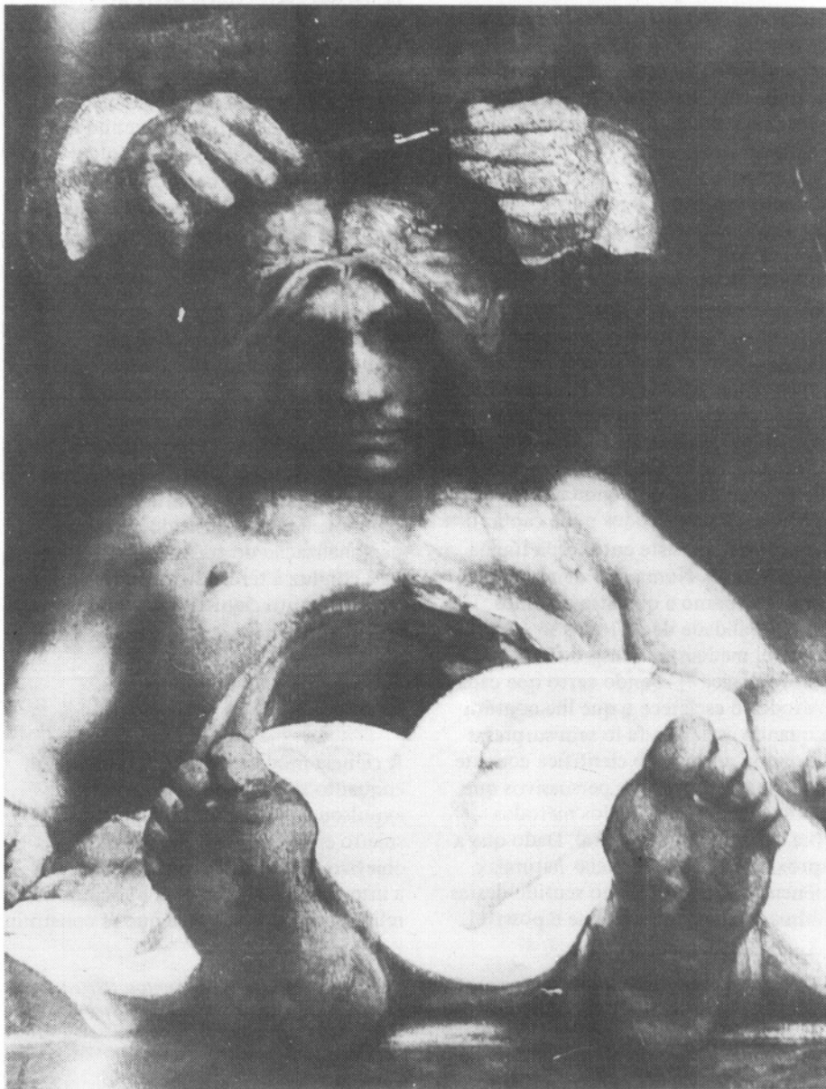
“A lição de anatomia do dr. Joan-Reyman”. Rembrandt van Rijn.

lugar, manter um espaço verde, construir um computador adequado às necessidades locais, fazer baixar a taxa de mortalidade infantil, inventar um novo instrumento musical, erradicar uma doença, etc., etc. A fragmentação pós-moderna não é disciplinar e sim temática. Os temas são galerias por onde os conhecimentos progridem ao encontro uns dos outros. Ao contrário do que sucede no paradigma atual, o conhecimento avança à medida que o seu objeto se amplia, ampliação que, como a da árvore, procede pela diferenciação e pelo alastramento das raízes em busca de novas e mais variadas interfaces.